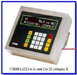
IT8000 ExZ222 in Ex zone 2 or Z2 (category 3) 防爆重量顯示器